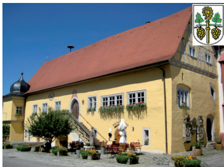
Markt Frickenhausen am Main