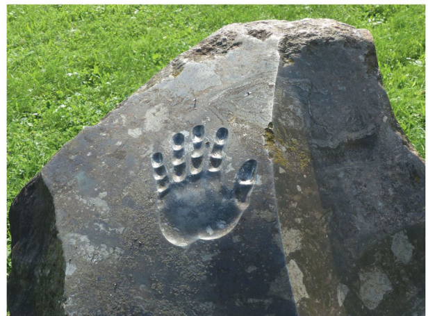
In der Himmelfahrtskapelle am Ölberg werden die Fußspuren gezeigt, die Jesus bei der Himmelfahrt hinterlassen hat. Heute ist es an den Christen, handfeste Spuren in der Welt zu hinterlassen. Denn – wie es der Theologe und ehemalige evangelische Bischof Klaus Engelhardt sagt: „Himmelfahrt bedeutet: Jesus Christus nimmt Abschied, weil er Zutrauen zur Gemeinde hat.“