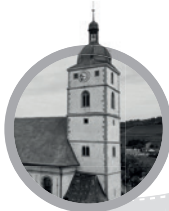
St. Bartholomäus, Sommerhausen