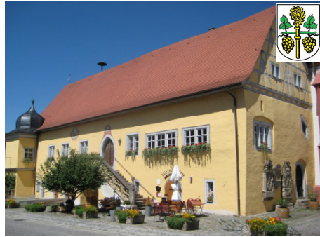
Markt Frickenhausen am Main