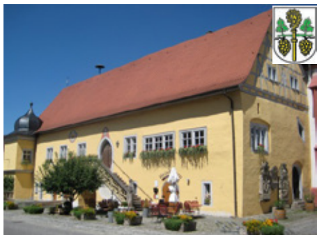
Markt Frickenhausen am Main