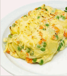
BIO Kartoffelauflauf mit Gemüse* mit Karotten und Erbsen, überbacken mit Käse