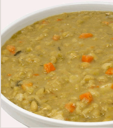
Vegetarischer Erbseneintopf mit Zwiebeln, Karotten, Lauch und Kartoffeln