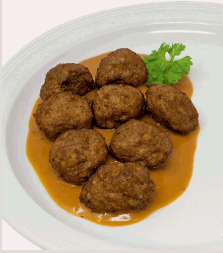
Köttbullar Rindfleischklößchen nach schwedischer Art in Preiselbeer-Rahmsoße