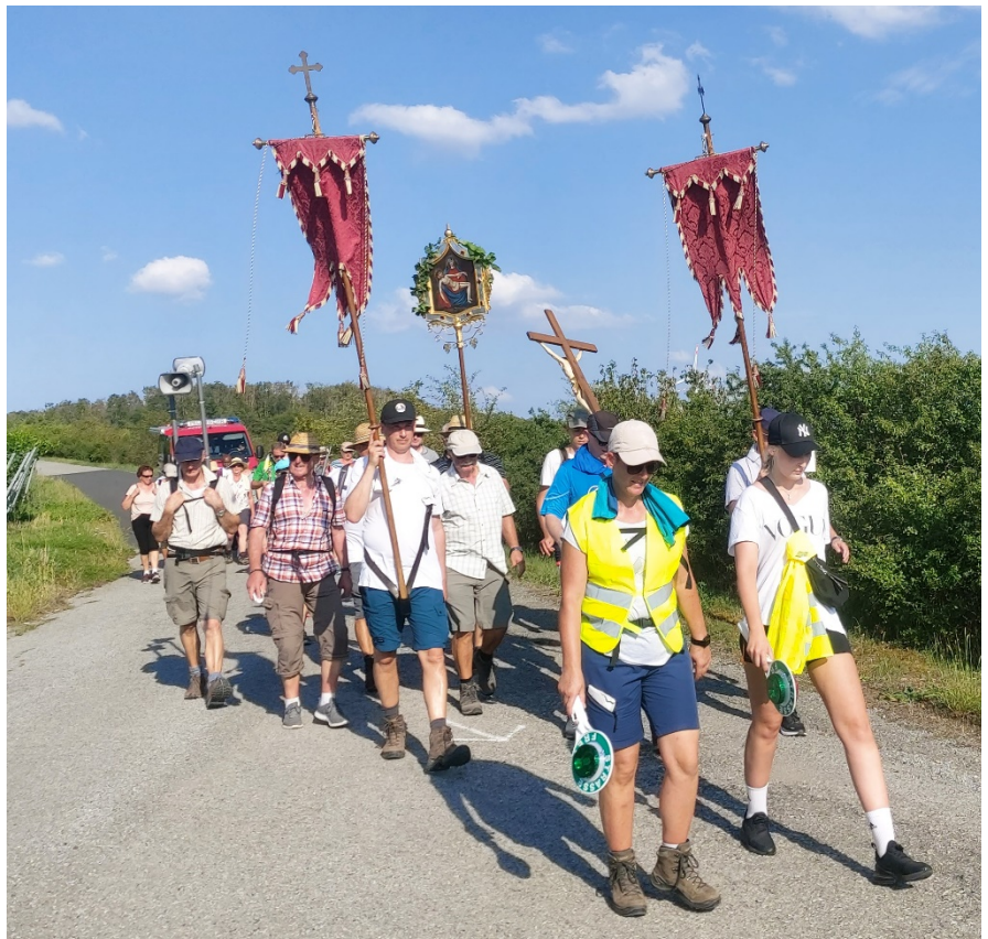
Dettelbachwallfahrt 2023 – letzte Meter vor Eibelstadt