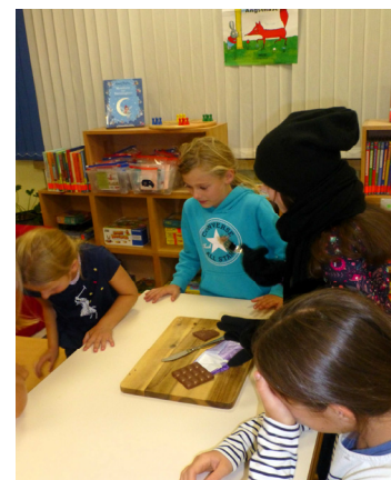
Geschafft! Und die Schokolade schmeckte sooo gut.

Jetzt war erstmal Lesen angesagt. Gemütlich auf dem Sofa oder auf Kissen zwischen den Regalen.